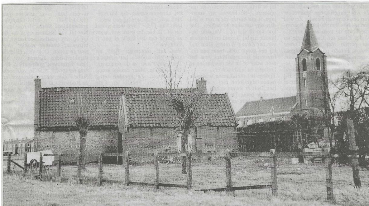
Pand Tillebuorren 45 te Kootstertille, afgebroken in januari 1996. Laatste bewoner R. de Wind. Op de achtergrond de N.H. kerk.